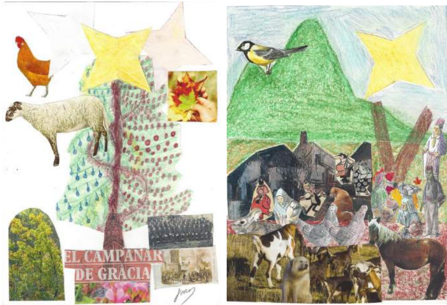
Collage realitzat per Joan Llopart

En aquesta secció exposem creacions dels propis residents. Animeu-vos a participar!